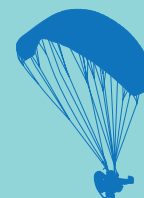
Paraglider med motor

Mindst 300m over den højeste menneskeskabte eller naturlige forhindring indenfor en radius af 600m og altid højde nok til at kunne glide til sikker landing.