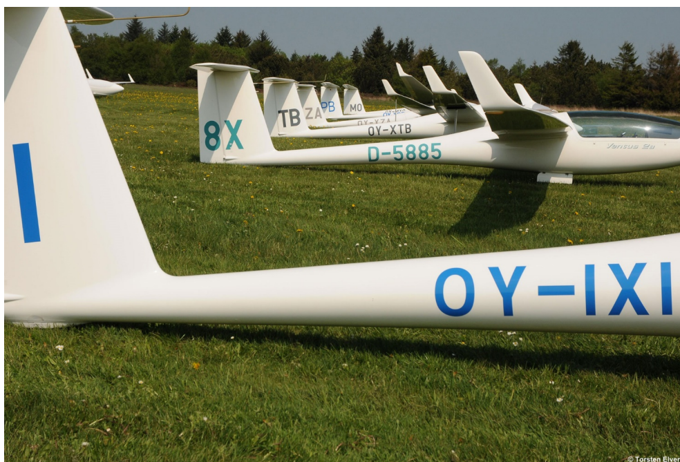
Startrække til DM 2018 af 15 meter klasse fly

Efter landing skal flyet hurtigst muligt fjernes fra landingsfeltet.