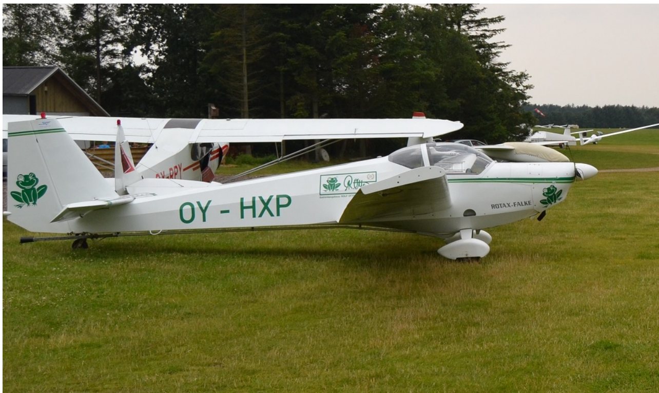
Svæveflyvecenter Arnborgs Rotax Falke, "Frøen"