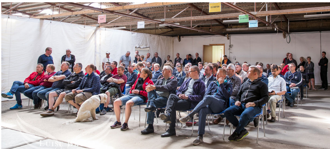
Piloter samlet til briefing ved danmarksmesterskaberne