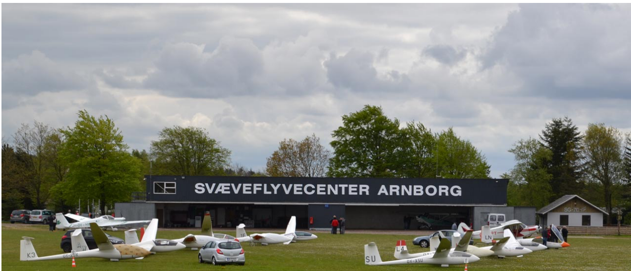
Hangar 1 - hovedbygning

Vi håber, du hurtigt finder dig tilrette på Danmarks nationalcenter for svæveflyvning.