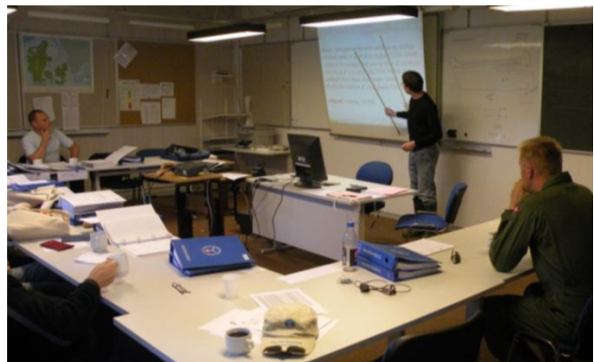
Briefingrum og undervisningslokale