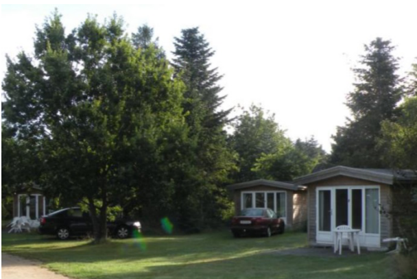
Udlejningshytter kan reserveres