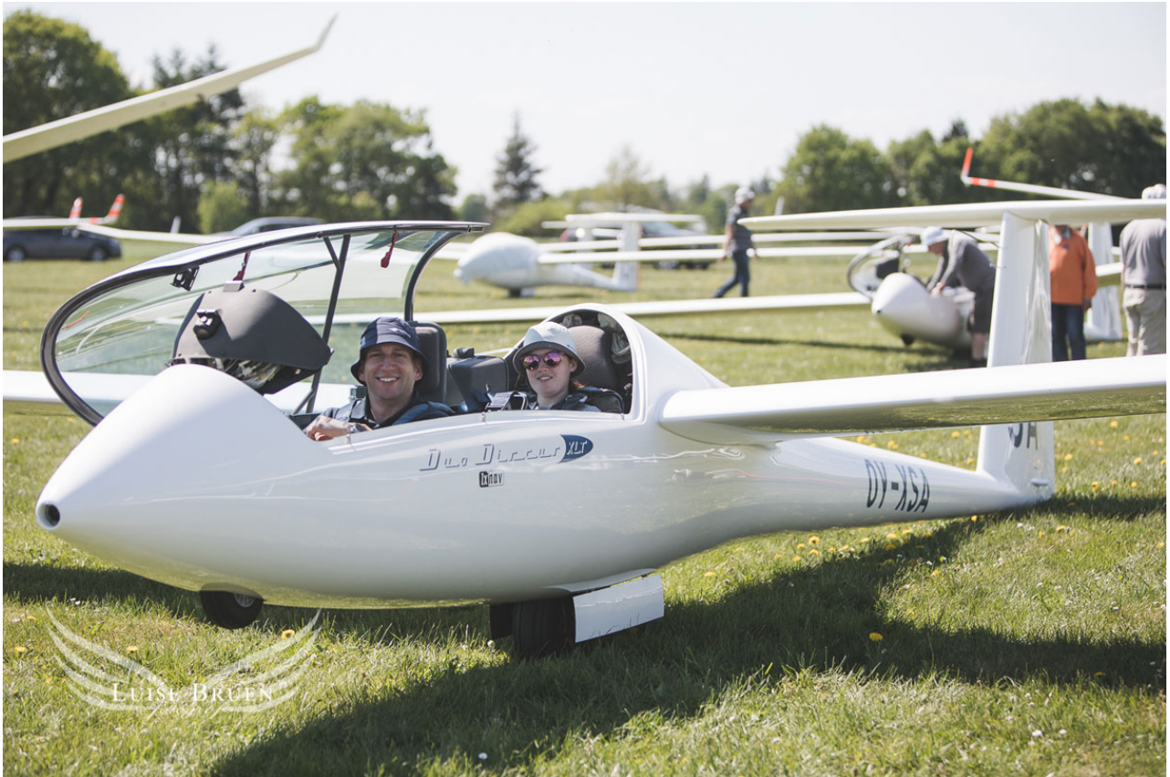
Svæveflyvecenter Arnborgs Duo Discus XLT